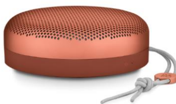
(Beoplay A1 / color: Tangerine Red)