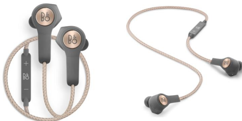
(Beoplay H5 / color: Charcoal Sand)